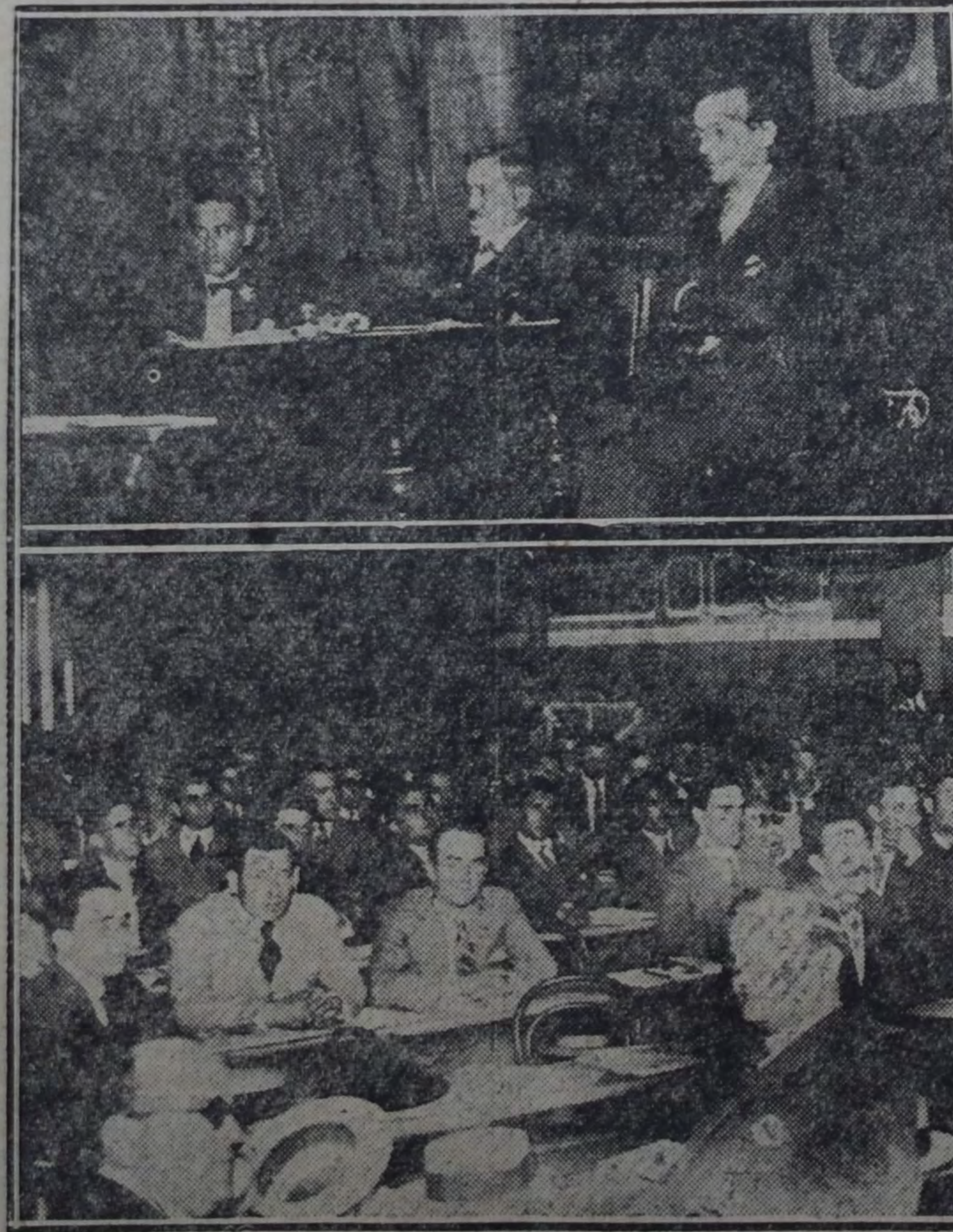
EL CONGRESO SESIONANDO — (Arriba): LA MESA DIRECTIVA.

Se aprueban igualmente los puntos: 90. — Reglamentación legal del servicio doméstico. 100. — Reglamentación higiénica de las fábricas, talleres y lugares de trabajo. 110. — Reglamentación higiénica del trabajo agrícola. 120.